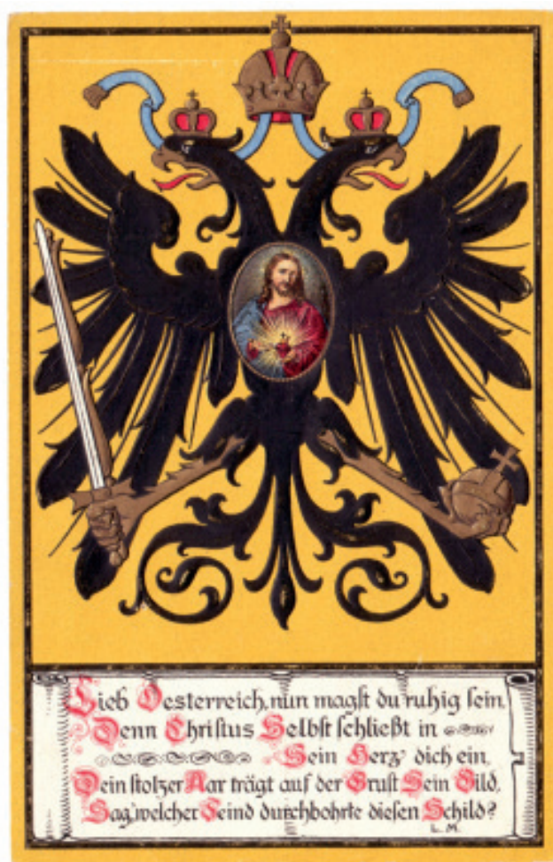
4. kép: Első világháborús propaganda képeslap, é.n. Josef Müller, München. Glässer Norbert tulajdona.