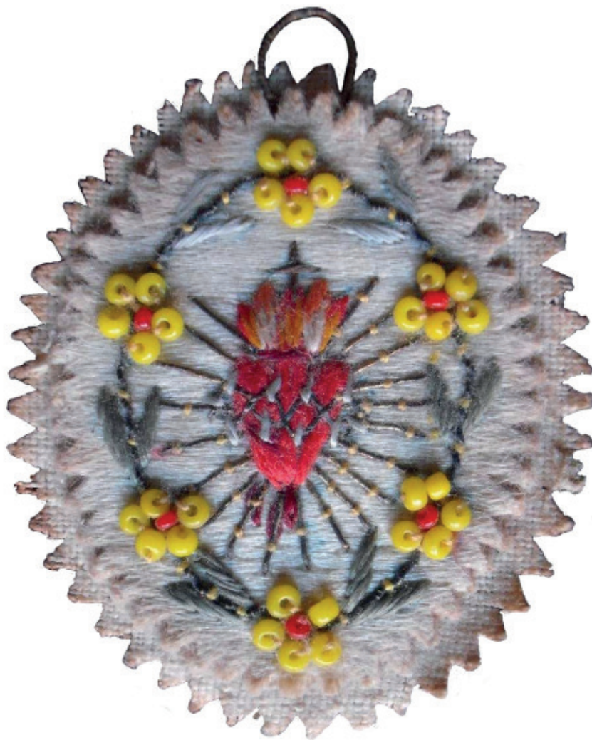
2. kép: Hímzett Jézus Szíve nyakék, 20. század eleje. A szerző tulajdona.